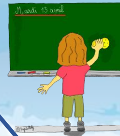
tableau TBI tablettes